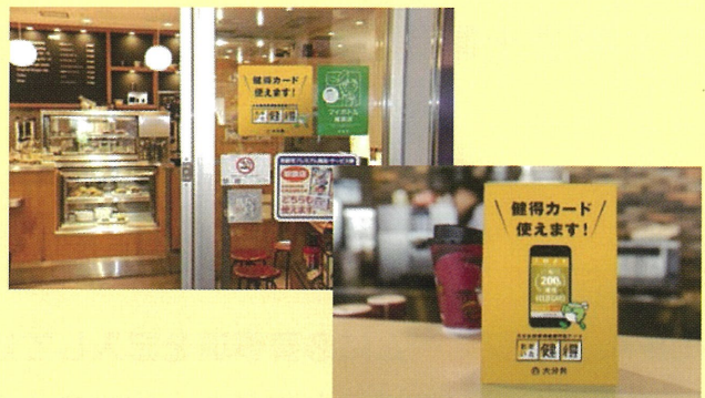
※ツール類 (イメージ)