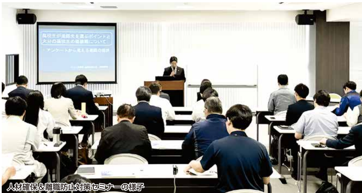
人材確保&離職防止対策セミナーの様子