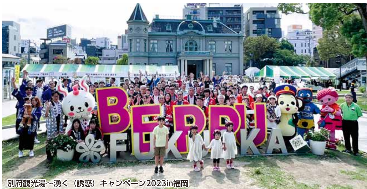
別府観光湯～湧く（誘惑）キャンペーン2023in福岡