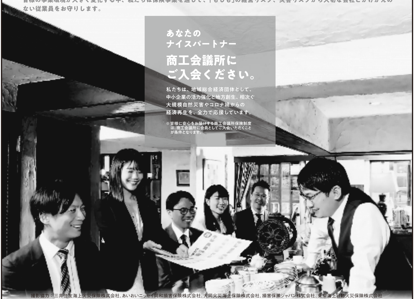
撮影協力：三井住友海上火災保険株式会社、あいおいニッセイ同和損害保険株式会社、大同火災海上保険株式会社、損害保険ジャパン株式会社、東京海上日動火災保険株式会社

※皆様に安心をお届けする商工会議所保険制度 は、商工会議所に会員としてご入会いただくこと が条件となります。