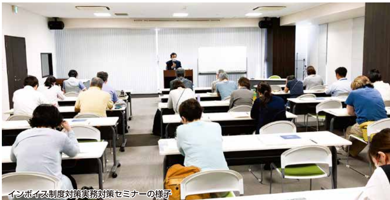
インボイス制度対策実務対策セミナーの様子