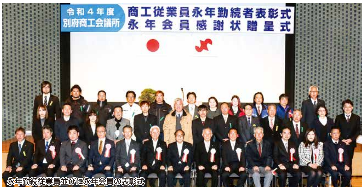
永年勤続従業員並びに永年会員の表彰式