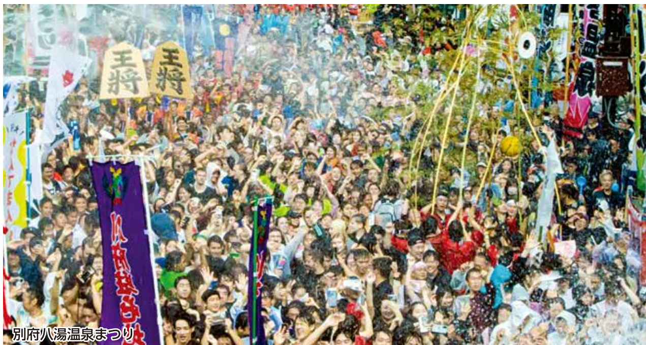
別府八湯温泉まつり