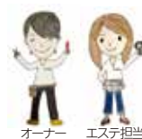
オーナー エステ担当

「会議所の所報を持参」または「電子メール券でお支払い」いただくと光フェイシャル10%offまたは脱毛10%offです。両方使用もOKです。