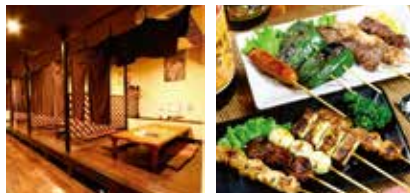
日出町に姉妹店あり

地元や観光のお客様からも人気の大分名物とり天。鮮魚店から直接仕入れた新鮮な刺身、琉球もおすすめ。日出町には姉妹店【ダイニングキッチン とり串日出店】が昨春にリニューアルオープン。全席個室と換気設備を導入し、より落ち着いた空間となりました。