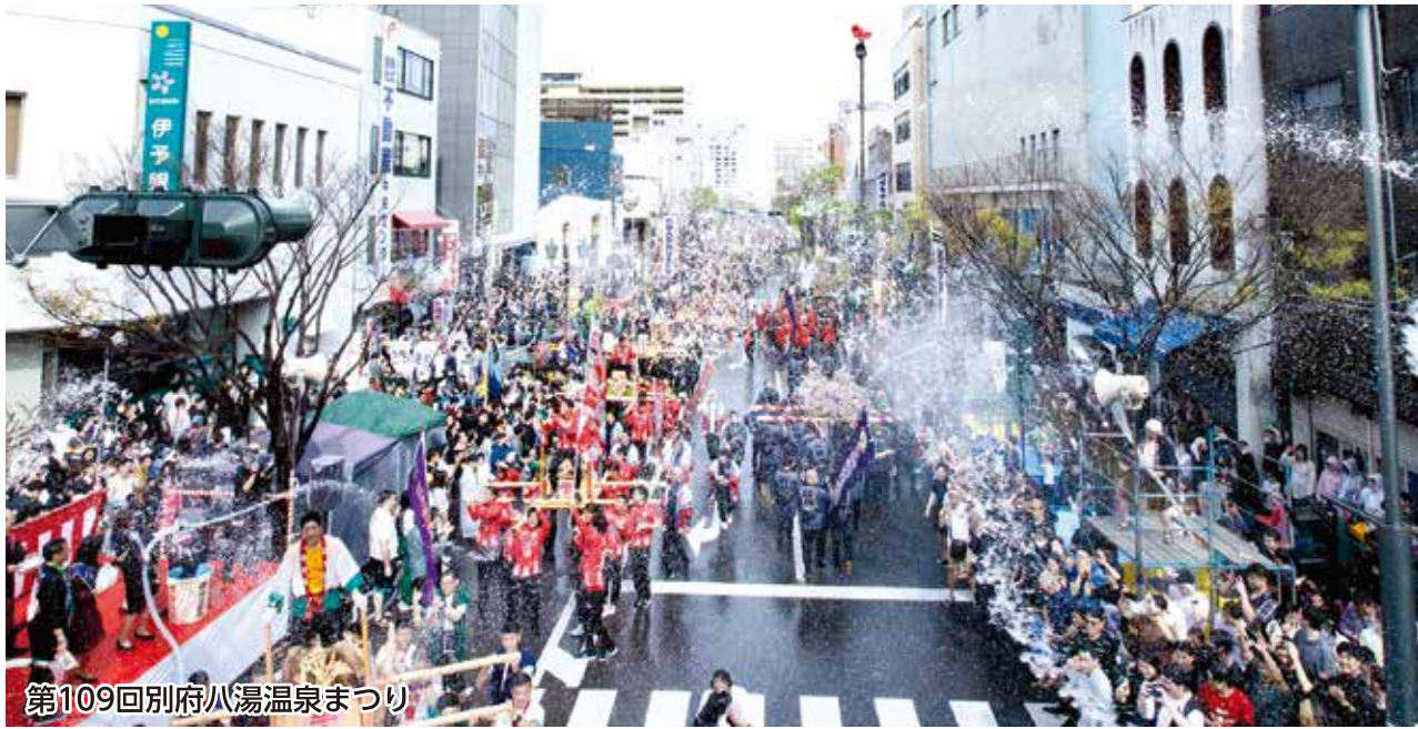
第109回別府八湯温泉まつり