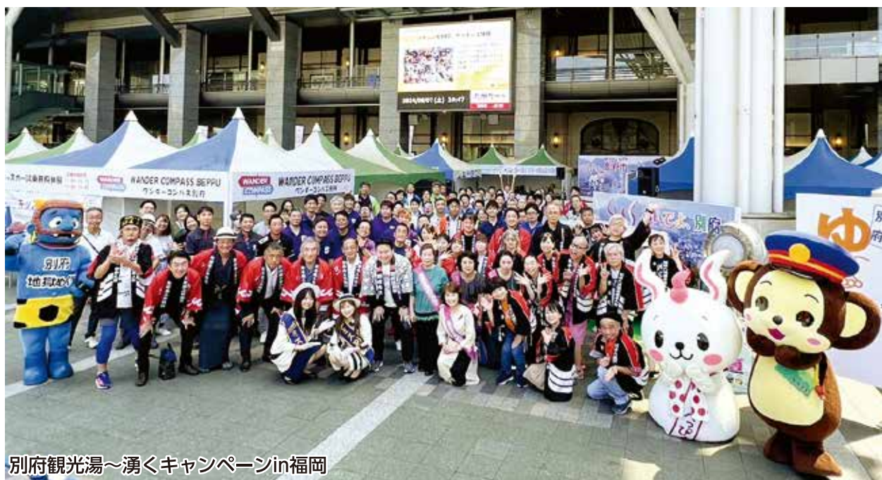
別府観光湯～湧くキャンペーンin福岡